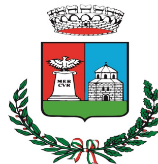
Comune di Arsago Seprio