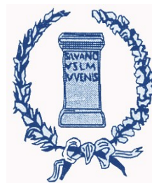
Associazione Pro Loco