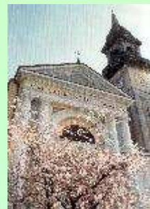
In Collaborazione con la PARROCCHIA SAN LORENZO

Coro Lirico lunedì e giovedì dalle 21,00 alle 23,00