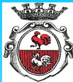
CITTA' DI GALLARATE

Continua l'attività concertistica in qualità di solista e di corista del Coro Lirico della Corale Arnatese.